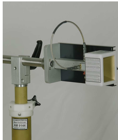
Bild 4 Montagebeispiel horizontal Figure 4: mounting example horizontal