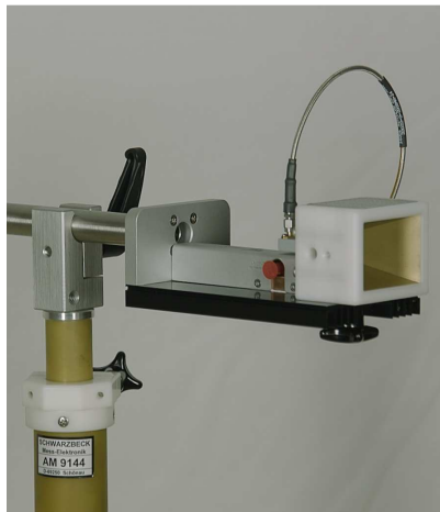
Bild 2 Montagebeispiel vertical Figure 2: mounting example vertical

Figures 2 to 4: Typical mounting examples of BBHA 9170 on BBV 9721 fixed with AA 9202 on AM 9144.