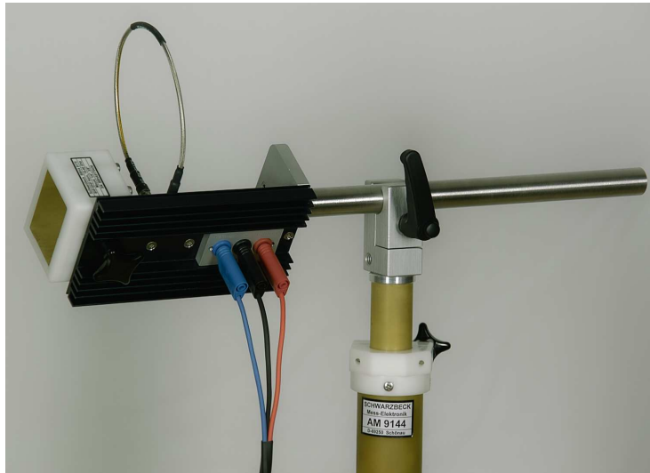
Bild 5: Unterseite des BBV 9721 mit Spannungsversorgungsanschlüssen Figure 5: bottom side of BBV 9721 with power supply jacks