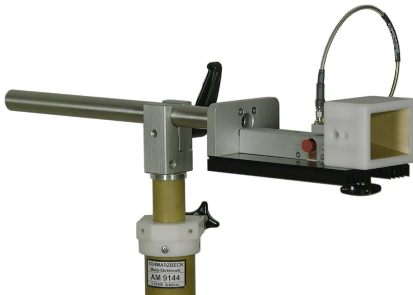
Bild 1: Vorverstärker BBV 9721 mit Hornantenne BBHA 9170 befestigt mit Adapter AA 9202 auf Stativ AM 9144 Figure 1: Preamp BBV 9721 with horn antenna BBHA 9170 fixed with the adapter AA 9202 on the tripod AM 9144